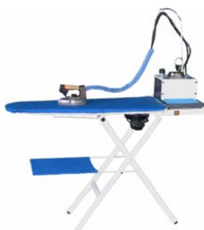
1A05 CON GENERATORE 1F31