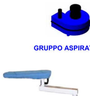
BRACCIO CON FORMA 1B01