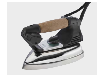
Ferro da stiro mod. EOS (fornito standard) Eos iron (standard equipment)